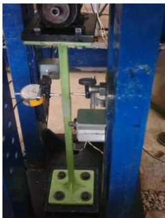
ب: نمونه یکسرمفصل یکسرگیردار، قبل از آزمایش