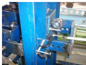
د: مهار فوقانی تکیه‌گاه مفصلی فوقانی