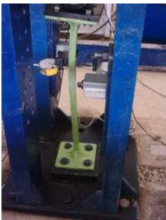
ج: نمونه یکسرمفصل یکسرگیردار، حین آزمایش

در حین آزمایشات از کرنش‌سنج‌هایی که با سه رشته سیم به کانال‌های دیتالاگر وصل می‌شود، استفاده شده است. برای اندازه‌گیری تغییر شکل‌های ستون نیز، از خیز سنج‌هایی در