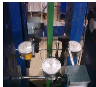
الف: نحوه اتصال خیزسنج‌های جانبی