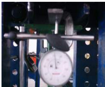
ب: نحوه اتصال خیزسنج‌های قائم